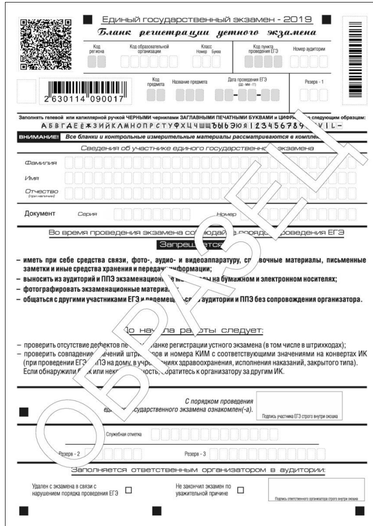
Рис 17. Бланк регистрации устного экзамена

Бланк регистрации устного экзамена заполняется так же, как обычный бланк регистрации (см. п. 3.3). В поле «Номер аудитории» указывается номер аудитории проведения устного экзамена. Служебные поля «Резерв-1», «Резерв-2» и «Резерв-3» не заполняются.