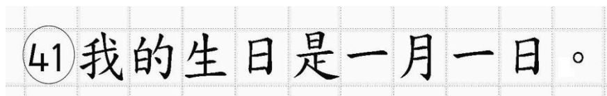
Рис.14. Образец написания иероглифических знаков

Односторонний бланк ответов № 2 (лист 1 и лист 2) предназначен для записи ответов на задания с развернутым ответом по китайскому языку (строго в соответствии с требованиями инструкции к КИМ и к отдельным заданиям КИМ). Каждый иероглифический знак и каждый знак препинания следует писать внутри отдельной клетки области ответов бланка ответов №2 (дополнительного бланка ответов №2) (рис. 14).